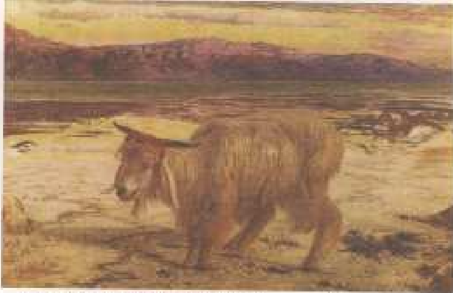
10 William Holman Hunt (1827-1910) The Scapegoat (Le Bouc émissaire)